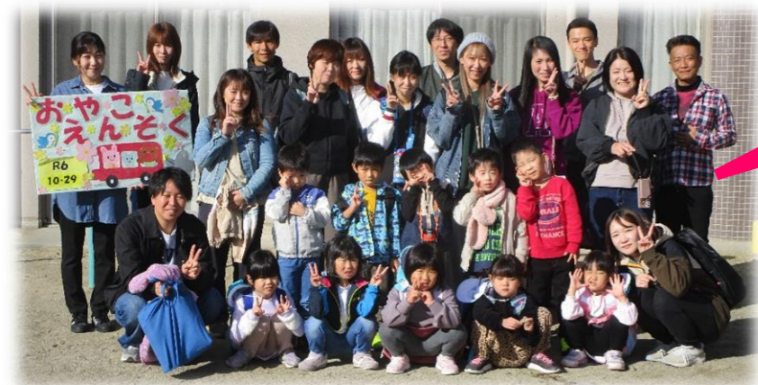
みんなでハイチーズ♡

10月29日(火)にぞう組の親子遠足がありました。天候が心配される中でしたが、当日は秋晴れの遠足日和でした◎この日をとても楽しみにしていた子ども達は前日からお弁当やおやつの話で盛り上がっていた子ども達。お母さんやお父さんとニコニコで登園し、バスに乗り出発!!公園に着くと「何で遊ぼうかな~!」「トランポリンだ!」ととてもワクワク♪アスレチックにトランポリン、ローラー滑り台にボールプール等豊富な遊具に大はしゃぎ!夢中になって沢山遊びました。お昼はみんなでお弁当を食べたり、おやつ交換をしたりしてゆったりタイム♡満足するとまた全力で遊び始める子ども達でした◎帰りのバスの中でも元気いっぱいの子はDVDを見たり、友達とお話をしたり、子ども達の体力に驚かされました。お家の人や友達と触れ合い、思い出に残る一日になりました♡