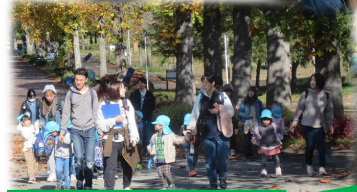
公園に到着!いっぱい遊ぶぞ~◎